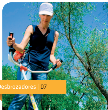
Desbrozadores | 07