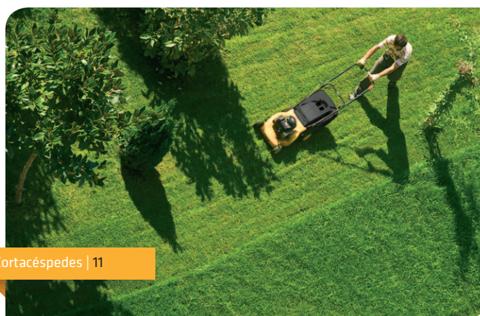
Cortacéspedes | 11