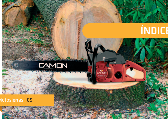
Motosierras | 05