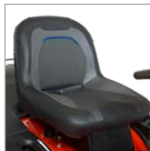
ASIENTO CON GRAN CONFORT El asiento ajustable de respaldo medio proporciona una conducción confortable y estable.