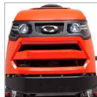
PARACHOQUES DE ACERO & LUCES DELANTERAS DE LED El parachoques de acero añade durabilidad a su tractor mientras las potentes luces Led ilumina su camino.