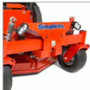
Kit de luces