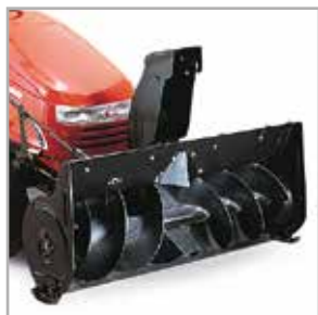
Quita nieve de una sola etapa