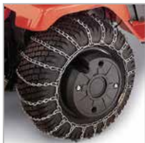
Cadenas de nieve para ruedas