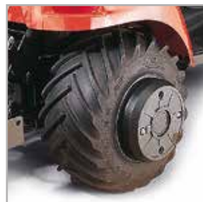
Contrapesos para ruedas