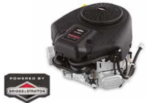
MOTOR BRIGGS & STRATTON®

El motor Briggs & Stratton Intek™ proporciona un arranque constante y garantiza un rendimiento duradero.