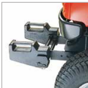
Contrapesos delanteros y traseros