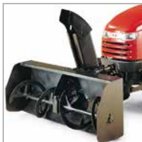
Quita nieve de doble etapa