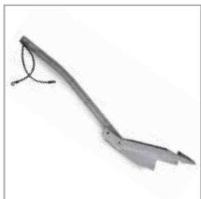
Tapón para mulching