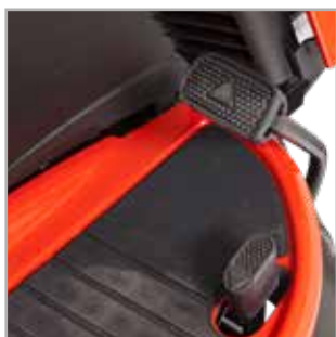
CONTROL DE VELOCIDAD Cambia tu velocidad rápida y fácilmente

La serie Regent™ RD SRD360 combina todas las últimas características de innovación y confort con un rendimiento excepcional. Experimente nuevos niveles de comodidad para el usuario con un asiento de malla ergonómico y transpirable y el exclusivo Sistema de suspensión™.