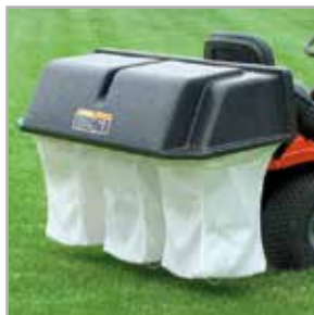
Recogedor bolsa triple