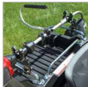
Kit soporte herramientas