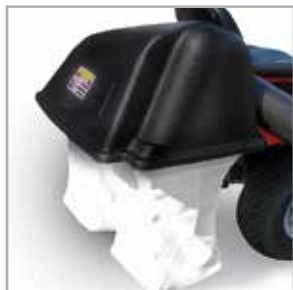
Doble saco de recogida