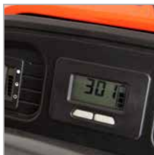
NUEVO DISEÑO DEL PANEL DEL CONTROL Este lujoso panel le muestra las necesidades de su máquina. El tablero contiene un medidor de combustible y un contador de horas. El recordatorio de mantenimiento hace que esta máquina sea interactiva.